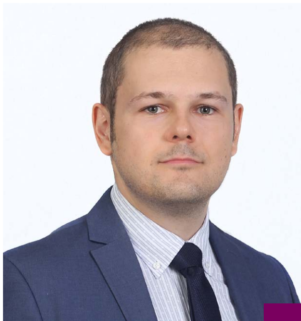
Д-р Симеон Гройсман