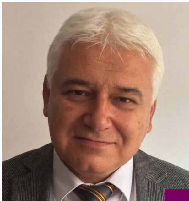
Проф. д-р Пламен Киров