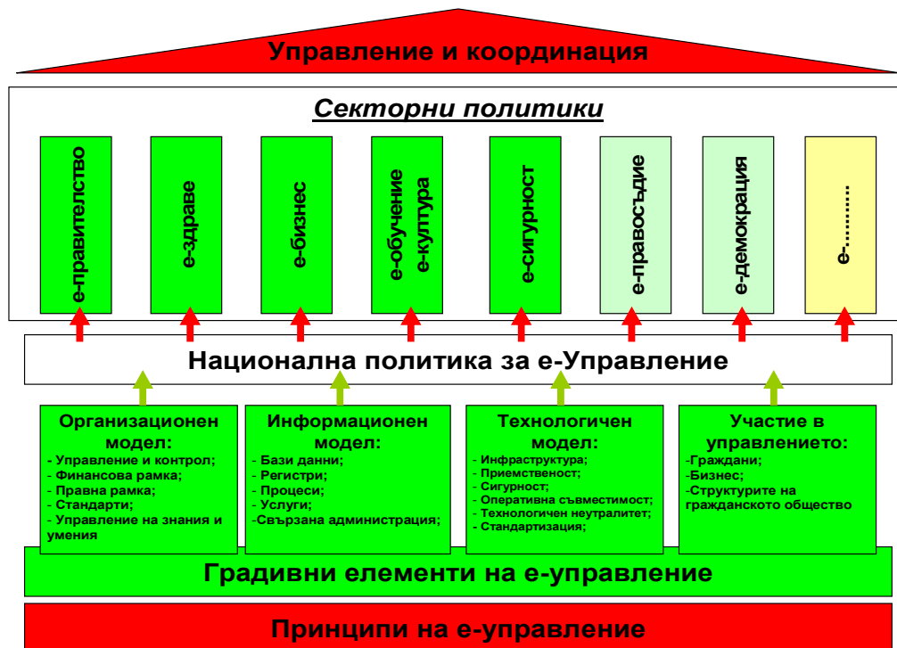
фиг. 1 Модел на електронното управление